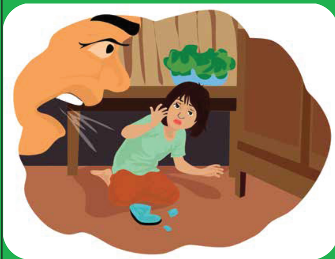
ការសម្អាត គំរាម និងជេរប្រមាថ