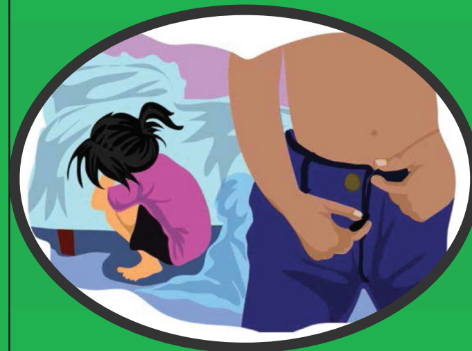
ការបៀតបៀន និងអំពើហិង្សាផ្លូវភេទ