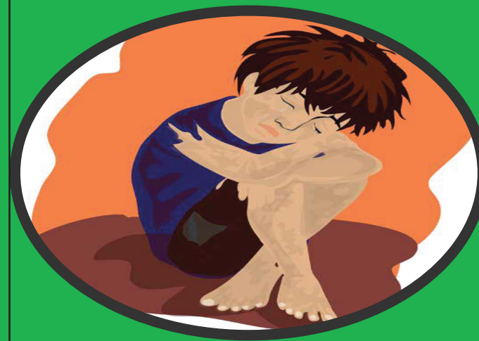
ការមិនខ្វាយខ្វល់ពីសុខភាព និងមិនផ្តល់ភាពកក់ក្តៅ